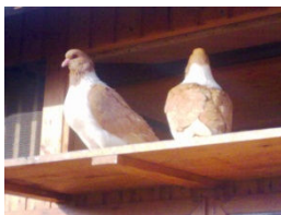
Žlté moravské pštrosy