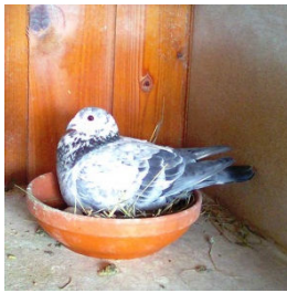
Spokojne hniezdiaci poštový holub