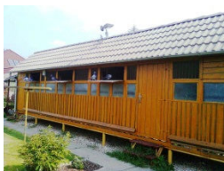
Poštové holuby po prelete okolo holubníka